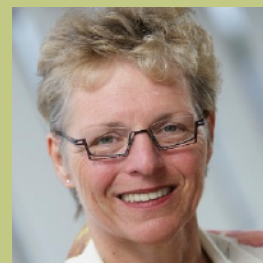
Ria Hendrikk Leadership Challenge® facilitator